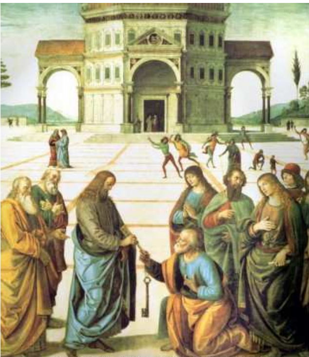
Perugino, Cristo consegna le chiavi a Pietro, 1482, Cappella Sistina, Vaticano

Ringraziamo il Signore per il Concilio Vaticano II , che ha messo nelle mani dei fedeli questa Parola, mentre prima era vietato. Questa è la ricchezza del secolo scorso.