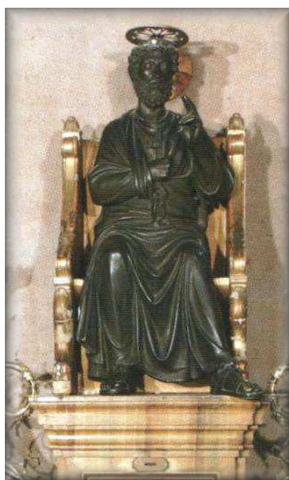
Parrocchia di Oleggio- San Pietro in trono